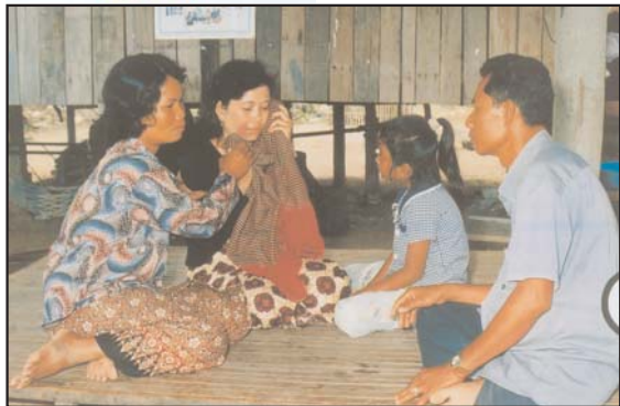
រស់ឆ្លៀតគិតថាកូនរបស់រស់អាច ជួយរស់បាន

កុមារអាចជួយយើងបានពេល មានអំពើហិង្សាក្នុងគ្រួសារ !