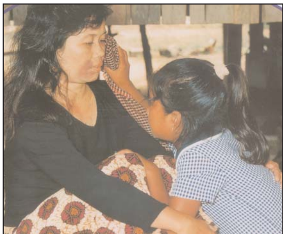
កូនអាណិតម៉ែកំណាស់.....។