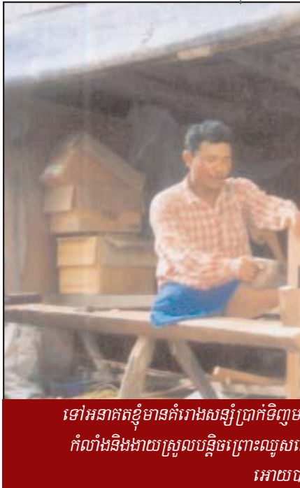
ទៅអនាគតខ្ញុំមានគំរោងសន្សំប្រាក់ទិញម កំលាំងនិងងាយស្រួលបន្តិចព្រោះល្អសរ អោយច

លក់បានក្នុងភូមិមិនបាច់ទៅឆ្ងាយពី ផ្ទះ" ។ ក្រោយពីចប់វគ្គសិក្សាមួយ ឆ្នាំក្រោយមកអង្គការមេត្តាករុណា បានផ្តល់ដើមទុនអោយខ្ញុំខ្លី ទិញ សំភារៈនិងឈើខ្លះដើម្បីប្រកបមុខ របរជាជាងធ្វើតុនិងជួយប្រពន្ធខ្ញុំ អោយលក់ចាប់ហួយនិងចិញ្ចឹមជ្រូក រួមផ្សំក្នុងជីវភាពប្រចាំថ្ងៃ ។ ក្នុង មួយខែគាត់អាចធ្វើទូបានពី២ទៅ៤ លក់ក្នុងទូមួយតំលៃ ១៨០.០០០ រៀលដោយចំណាយដើម អស់១០៥.០០០រៀលបច្ចុប្បន្ននេះ អាចរកផលចំណូលបានពី១៤.០០០ រៀល ទៅ ១៥.០០០រៀល ក្នុងមួយថ្ងៃ ។ " ទន្ទឹមនឹង នោះខ្ញុំមានដីស្រែចំនួន