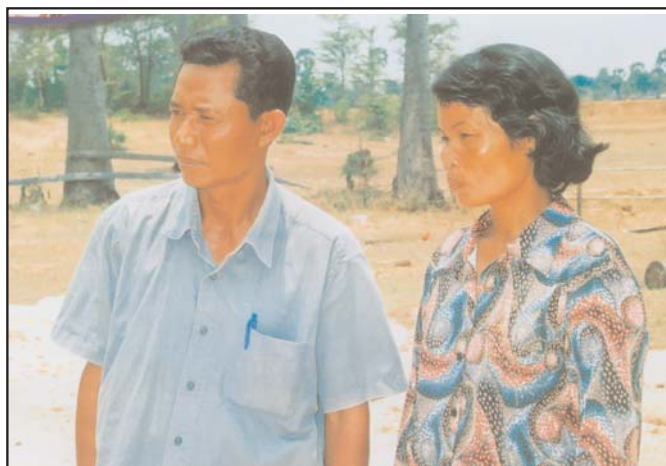
មានភ្លើងអីហ្នឹង.....