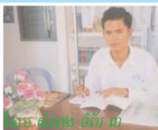
សាម ធីតាង ទំព័រ ៣