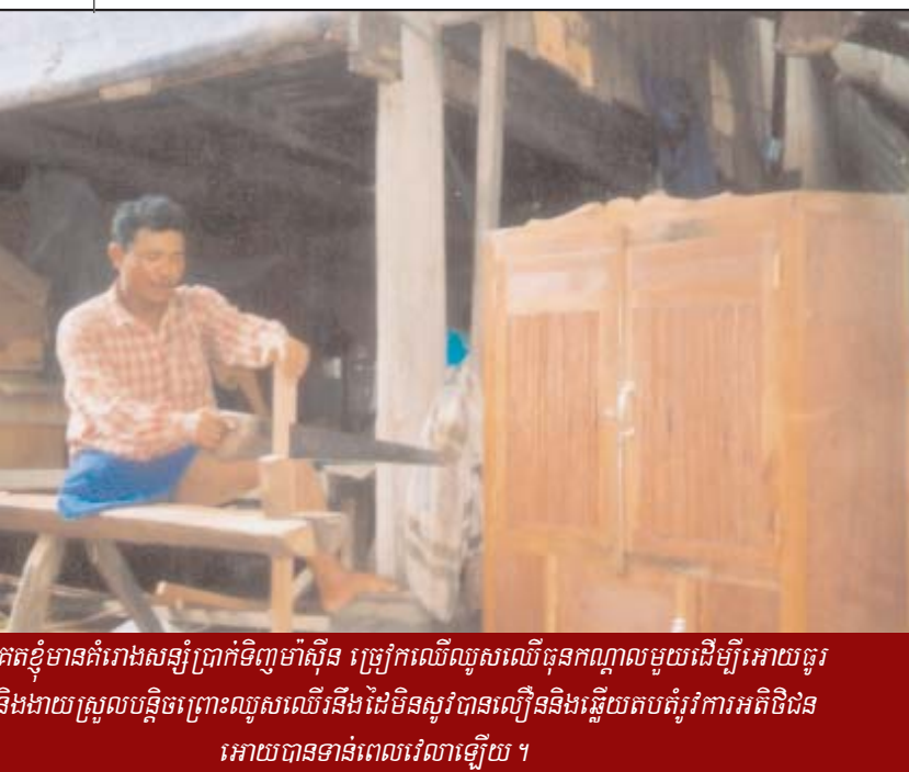
គតខ្ញុំមានគំរោងសន្សំប្រាក់ទិញម៉ាស៊ីន ច្រៀកឈើឈូសឈើធុនកណ្តាលមួយដើម្បីអោយធូរ និងងាយស្រួលបន្តិចព្រោះឈូសឈើនឹងដៃមិនសូវបានលឿននិងឆ្លើយតបតំរូវការអតិថិជន អោយបានទាន់ពេលវេលាឡើយ ។

១៧ វីរ(២,៧២ហិចតា)ដែលទទួលបានផលស្រូវបានពី៥០ទៅ៥៥បារ ក្នុងមួយឆ្នាំដែរ ។ ទៅអនាគតខ្ញុំមានគំរោងសន្សំប្រាក់ទិញម៉ាស៊ីន ច្រៀកឈើឈូសឈើធុនកណ្តាលមួយ ដើម្បីអោយធូរកំលាំង និងងាយស្រួលបន្តិចព្រោះឈូសឈើនឹងដៃមិនសូវបានលឿននិង ឆ្លើយតបតំរូវការអតិថិជនអោយបានទាន់ពេលវេលាឡើយ ។