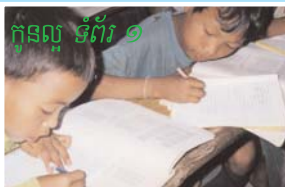
កូនល្អ ទំព័រ ១

តើ មានចំណុចអ្វីខ្លះដើម្បីអោយខ្ញុំ ក្លាយទៅជាកូនល្អ?