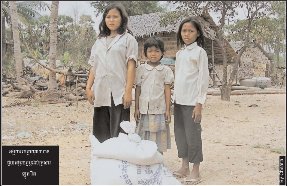
អង្គការមេត្តាករុណាបាន ជួយអង្វរឧត្តម្តជនគ្រួសារ ឡូត វិត

ពោរពេញទៅដោយកំហឹងដល់ជនដែលគ្មានចិត្តមេត្តាធម៌ បន្តិចសោះនោះ ។ ភ្លាមៗនោះផងដែរក្រុមគ្រួសារបាន រាយការណ៍ទៅប៉ូលីស ភូមិ ឃុំ ស្រុក ខេត្ត រហូតដល់ម៉ោង ១១ យប់ទើបប៉ូលីសបានពិនិត្យសាកសពនិងពេទ្យធ្វើកោស- ល្យវិថីយជាលទ្ធផលឃើញថាក្មេងស្រីនេះត្រូវគេរំលោភមែន បន្ទាប់មកសំណប់ដើម្បីបំបាត់ភស្តុតាង ។ សពនេះត្រូវរក្សា នៅកន្លែងកើតហេតុរហូតដល់ពេលព្រឹកទើបសាច់សារ លោហិតយកមកកំលាំងទុកលើគ្រែព្រាមជិបូលប្រក់ស្លឹក