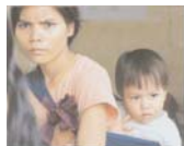
ព្រាបសន្តិភាពសង្គមខ្ចីពី ព័ត៌មានជនជាតិភាគតិចតំបន់ ភ្នំវៀតណាម