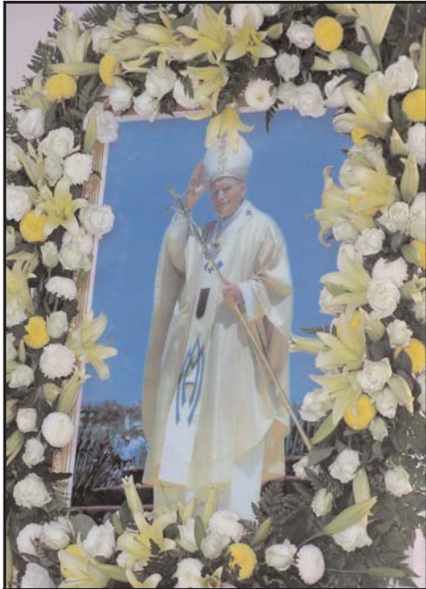
រូបថតរបស់សម្តេចប៉ាប យ៉ូហាន ប៊ូលីដ