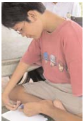
"មិនជាការងាយស្រួល ទេដោយប្រើដើងក្នុង ការសរសេរ " ទំព័រ២