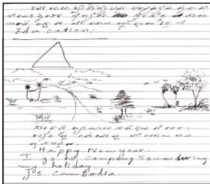
នេះជាកំនូរនិងអក្សរដោយប្រើដើងជំនួសដែរ

សៀវភៅចំណាមរណៈទុក្ខថាព្រះអង្គសូម សំដែងនូវសេចក្តីក្រៀមក្រមយ៉ាងខ្លាំងចំពោះ អនិច្ចេម្ម របស់សម្តេចប៉ាប យ៉ូហាន ប៉ូលទី២ ហើយព្រះអង្គបានថ្វាយសារនិងផ្កាគោរពវិញ្ញា ណក្ខន្ធជូនចំពោះសម្តេច ប៉ាប ។ មុខបញ្ចប់ អភិបូជាលោកអភិបាលបូជាចារ្យនិងគ្រីស្ទបរិ ស័ទ្ធបានអរព្រះគុណ ព្រះករុណាព្រះបាទ បរមនាថនរោត្តមសីហមុនី ដែលបានចូលរួមរំ លែក មរណៈទុក្ខនេះ ។ ដោយ ណុត-TinTin