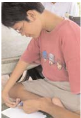
"មិនជាការងាយស្រួល ទេដោយប្រើដើងក្នុង ការសរសេរ" ទំព័រ២