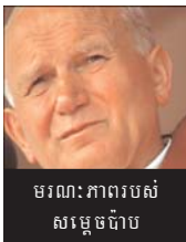
មរណៈភាពរបស់ សម្តេច ហ៊ុន សែន