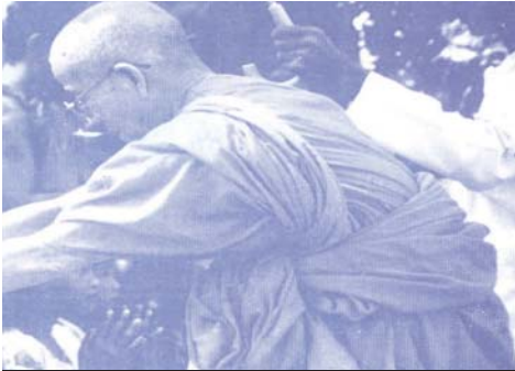
សង្គ្រាមដើម្បីទទួលបានការរស់នៅដោយសេចក្តីសុខសាន្តជាអមតៈ

បានយាងបដិសណ្ឋារកិច្ចក្នុងធម្មយាត្រាជាមួយ និងសេចក្តីថ្លែងការណ៍អបអរសាទរយ៉ាងជ្រាលជ្រៅដល់ធម្មយាត្រាហើយទ្រង់បានអំពាវនាវដល់គ្រប់គណបក្សទាំងអស់អោយបញ្ឈប់នូវអំពើហិង្សានិងការស្តាប់ខ្លឹមគ្នាហើយបំបាត់ចោលនូវគំនិតសងសឹកគ្នា។ នៅខែមិនាចាប់តាំងពីថ្ងៃទី ១០ដល់ ថ្ងៃទី៣១ឆ្នាំ២០០៥ ខាងមុខនេះមជ្ឈមណ្ឌលធម្មយាត្រានិងរៀបចំធ្វើធម្មយាត្រាលើកទី១៥ក្នុងគោលបំណងប្រាំចំណុចគឺអំពីសិទ្ធិមនុស្ស (សិសប្រាំ) បរិស្ថានធម្មជាតិ មច្ឆាជាតិ បឹងទន្លេសាប លើកទឹកចិត្តអ្នកផ្ទុកមេរោគអេដស៍ គ្រោះថ្នាក់ការប្រើគ្រឿងញៀន។ By TinTin